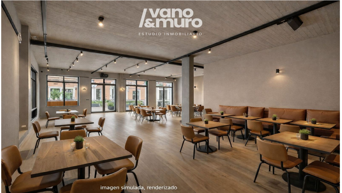
imagen simulada, renderizado

Vano & Muro les presenta este local en esquina en Pozo Amarillo por 100.000 €